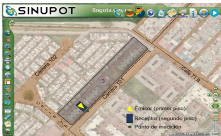
Figura 1. Ubicación del predio emisor, receptor (Carrera 101 No. 70 – 55) y punto de medición.